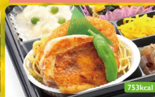
4 鶏串パイシー焼き キャベツサウザンサラダ / シチュー