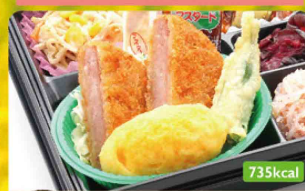
5 厚切りハムカツ 大根サラダ / 白滝真砂め