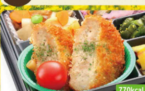
31 メンチカツ もやし旨塩炒め / さつまいもサラダ