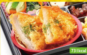
10 トンカツ 切干大根煮 / カリフラワーサラダ