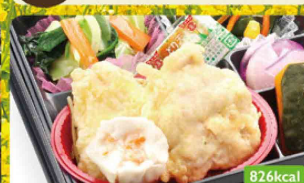
25 とり天 キャベツソテー / かぼちゃ煮風あん