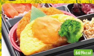
21 オムレツ カレーソース カニクリームコロッケ / 洋風肉じゃが