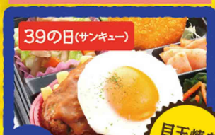
7 目玉焼きハンバーグ