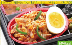
24 豚肉生姜炒め ハムクラッチカツ / インゲンおかか和え