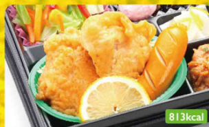
13 鶏唐揚げ ねぎみそ / ひじき煮