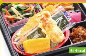
3 のり弁風 金平ごぼう / 青菜酢味噌和え