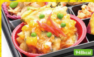
14 かき揚げ 玉子あん 豚汁風煮 / さつまいもレモン煮