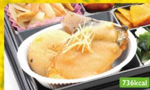
12 さばみそ煮 春巻き / オニオンサラダ