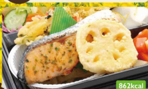
28 サーモン磯辺焼き お好みかき揚げ / 煮物盛り合わせ