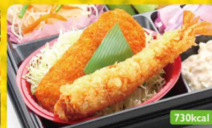
11 エビフライ & イカフライ / タルタルソース