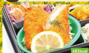
26 アジフライ 手作りタルタルソース / メンマ炒り煮