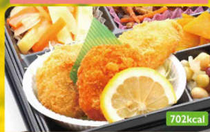
6 ササミフライ & ヒレカツ / ビーンズサラダ