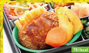
18 和風ハンバーグ 目玉焼きフライ / もやし中華和え