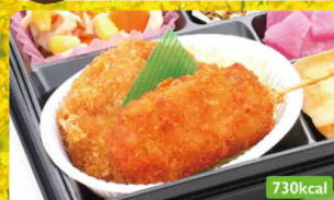
19 チーズインメンチ & 串カツ / れんこんバターソテー