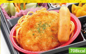
17 チキンカツ 青菜ピーナツ和え / きのこソテー